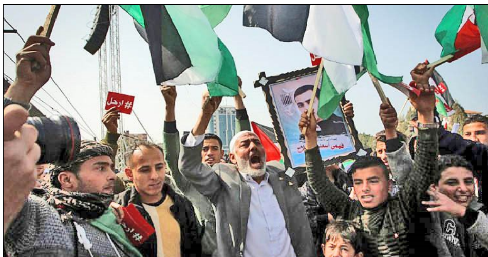
Protest i Gaza mod den palæstinensiske præsident Mahmoud Abbas.

På trods af manglende politiske bånd mellem Israel og Selvstyret opretholdes sikkerhedssamarbejdet ifølge israelske militære kilder. Selvstyret stoler på Israel som et højere intelligensniveau, siger israelske kilder og bemærker at samarbejdet tjener begge parter til at forsvare mod Hamas og andre terrorgrupper.