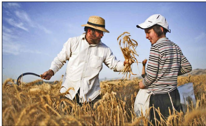
Jødiske mænd høster hvede til matzah i på en mark.