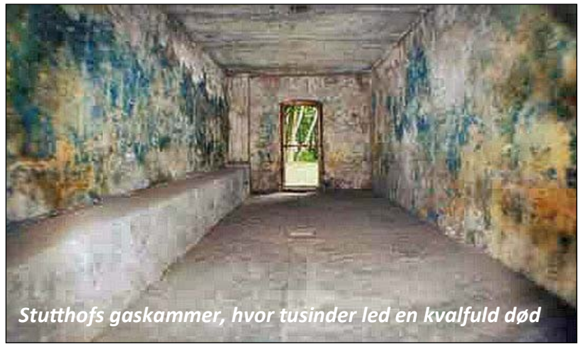
Stutthofs gaskammer, hvor tusinder led en kvalfuld død

Den tyske avis Die Welt rapporterer, at manden under efterforskningen af sin sag erkendte han var vidende om lejrens gaskamre og at organer blev udtaget på krematorierne. Han slutter sig til en langsomt voksende liste over folk fra flere nationer, der har skabt sig en ny tilværelse i Hamburg.