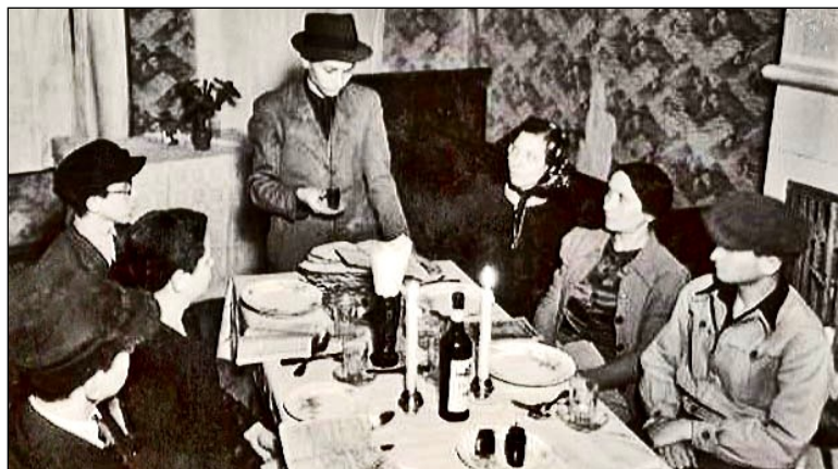
Originalt foto af den sidste seder i ghettoen 17. april 1943 før oprøret.

De tre grupper holder Seder sammen for at vise jødisk enhed i den sandsynligvis mest bevægende Seder i år.