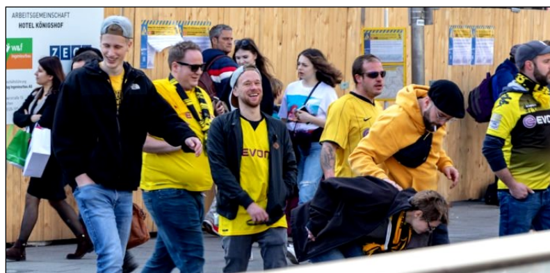
Borussia Dortmund-fans gør sig klar til en kamp.

Den slags overgreb oplever vi oftere og oftere" siger Forsknings- og Informationscenter for Antisemitisme RIAS .