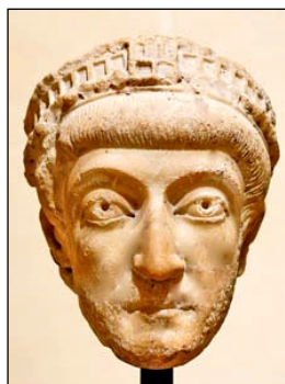
Kejser Theodosianus II