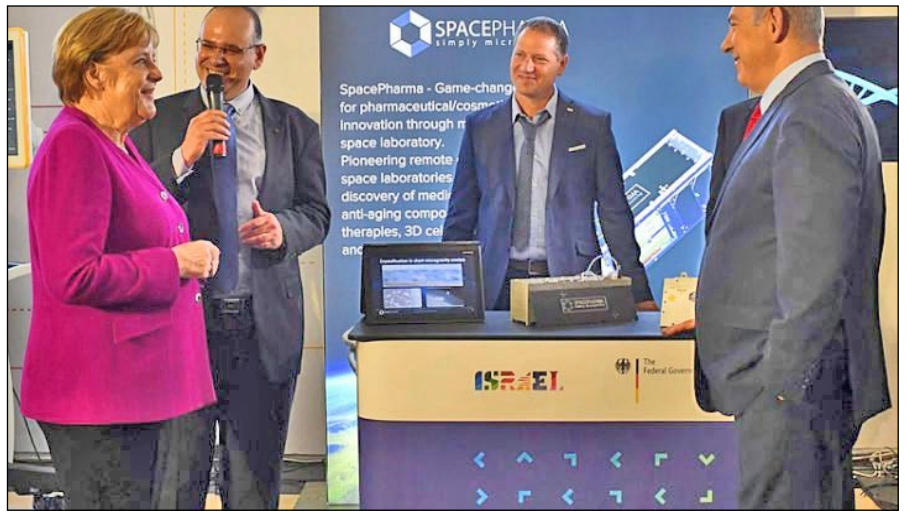
Netanyahu og Merkel på en nyhedsudstilling i Israelmuseet i Jerusalem 2018.

Israel kom ind på 5. pladsen for intensiteten af forskning og udvikling, koncentrationen af forskere, antallet af fagfolk beskæftiget med forskning og udvikling, patentaktivitet samt højteknologisk tæthed, defineret som antal af indenlandske højteknologiske offentlige virksomheder.