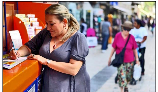
Kvinde køber et lod i et lotteri i Jerusalem.

"Det har altid været vigtigt for os at være velgørende" tilføjede manden. "Vi har givet noget i alle disse år, og det gør vi også nu. Vi vil som sædvanlig give tiende af vore indtægter og så skal alle vore børn have deres egen lejlighed."