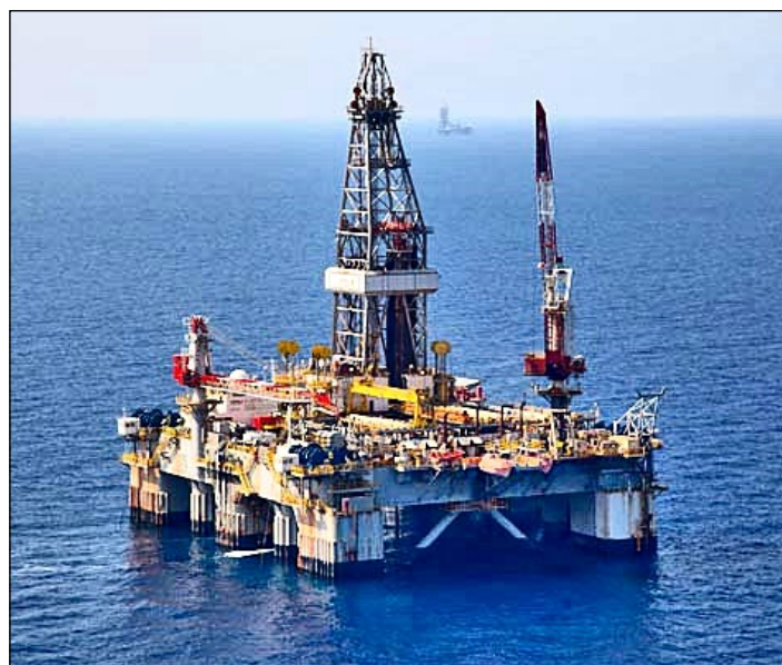
Boreplatformen Leviathan i Middelhavet.

EU søger at blive mindre afhængig af russisk gas - et tilbagevendende stridspunkt i forbindelse med politiske konflikter - og tilskynder til nye leveringsruter, herunder East Med-Pipeline , som arbejder på, at Israel i sidste ende sælger gas via Grækenland, Italien, og Cypern.