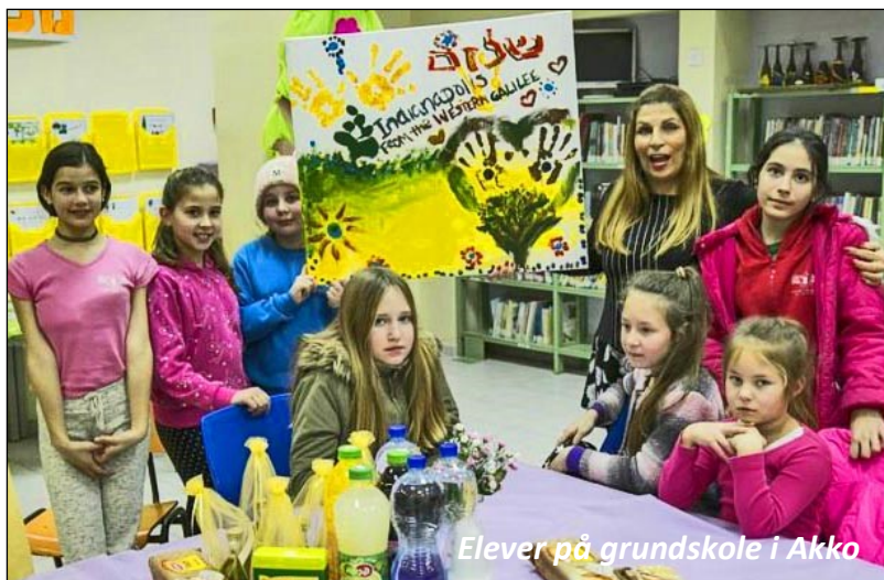
Elever på grundskole i Akko