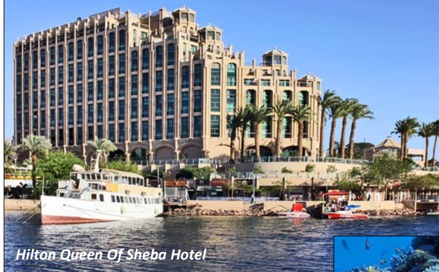
Hilton Queen Of Sheba Hotel