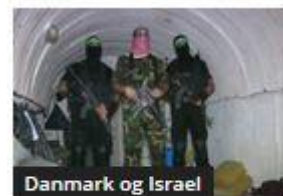
Gaza Works – eller er det Hamas?

At hjælpe med at overvåge de danske medier, opinionsdannere og politikere og sørge for rettelser og modspil.